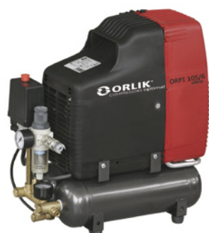
ORFI 105/6 oilless