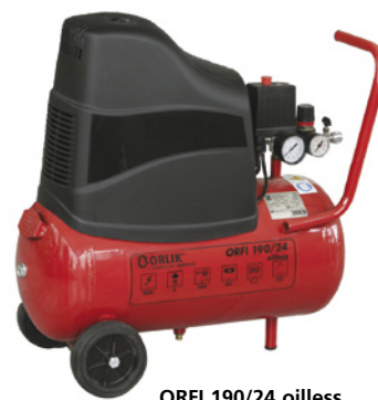
ORFI 190/24 oilless