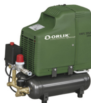
ORFI 205/6 oilless