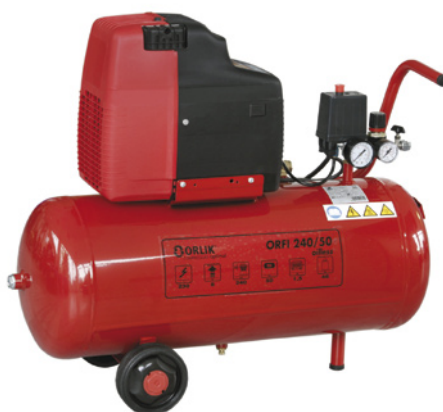
ORFI 240/50 oilless